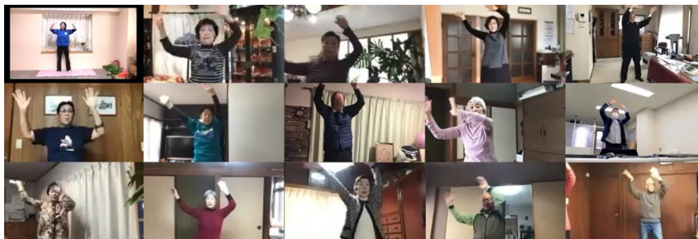
トライアルの様子