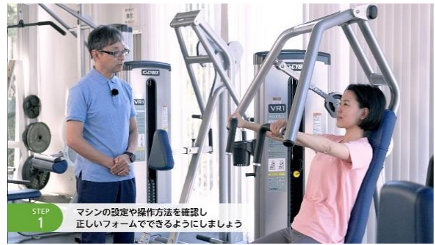
STEP 1 マシンの設定や操作方法を確認し正しいフォームでできるようにしましょう