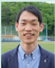
公益財団法人 明治安田厚生事業団 体力医学研究所 研究員

運動中の気分や楽しさは運動の継続率に関係するといわれています。きつい運動が苦手な方も、スローエアロビックのような軽い運動を楽しく続けることで、これからの健康づくりを楽しんでいきましょう。