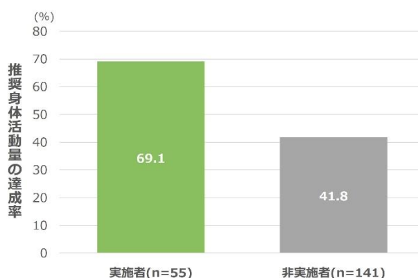
図2 活動量計装着中の運動・スポーツ実施有無による推奨身体活動量の達成率

活動量計装着中に運動・スポーツを実施したかをたずね、実施の有無による推奨身体活動量の達成率を分析した。運動・スポーツの実施者69.1%、非実施者41.8%がそれぞれ推奨身体活動量を達成しており、運動・スポーツの実施者のほうが達成率は高かった。