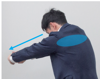
④息を吐きながら背中を伸ばす