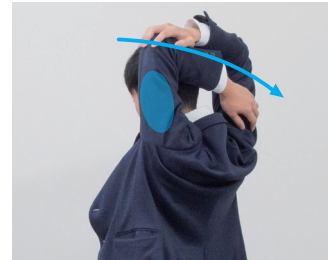
③肘を持ちながら反対側の上腕を伸ばす