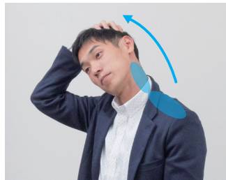
⑤首を横に傾けて首すじを伸ばす