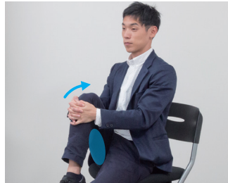
②膝を引き寄せて太ももの裏を伸ばす